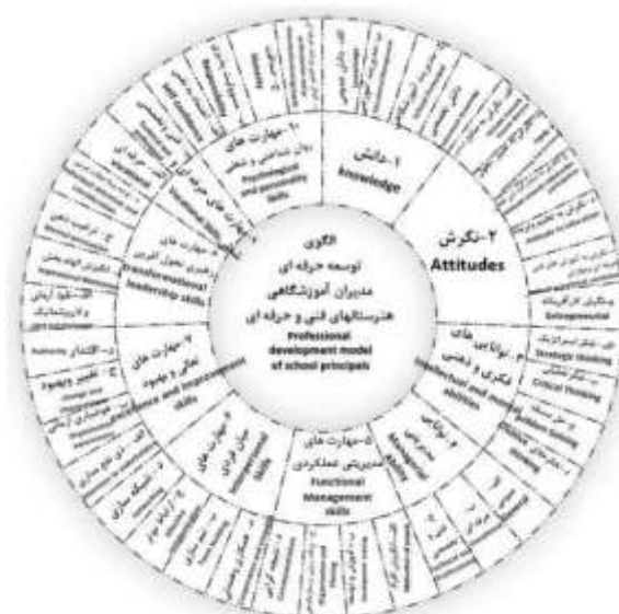
شکل ۱: الگوی توسعه حرفه‌ای مدیران آموزشی