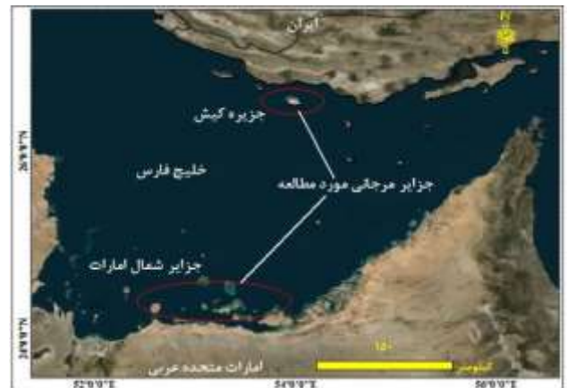
شکل ۱: موقعیت منطقه مورد مطالعه

در شکل ۱ منطقه و جزایر مرجانی مورد مطالعه در شمال و جنوب خلیج فارس مشخص شده است. جزیره کیش در بخش شمالی خلیج فارس و جزایر شمالی امارات متحده عربی در بخش جنوبی خلیج فارس به عنوان نمونه‌های موردی جزایر مرجانی خلیج فارس در این تحقیق مورد بررسی قرار گرفته‌اند. این منطقه دارای آب‌وهوای نیمه حاره‌ای است که در اکثر فصول سال گرم و مرطوب می‌باشد. تابستان‌های آن داغ و رطوبت هوا گاهی به ۱۰۰٪ نیز می‌رسد و زمستان‌های آن ملایم است.