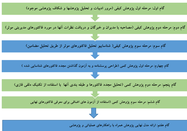
شکل ۱: گام‌های اجرایی پژوهش