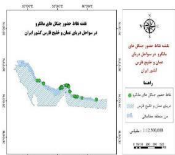
شکل ۱: موقعیت منطقه مورد مطالعه (محدوده جنگل‌های مانگرو در ایران)

نتایج حاصل از مدل‌سازی توزیع گونه‌ای حرا نشان داد متغیرهای حداقل کلروفیل، میانگین کلروفیل، مجموع حداکثر کلروفیل و pH به ترتیب بیش‌ترین تأثیر را بر پیش‌بینی حضور حرا در جنگل‌های مانگرو ایران دارند (جدول ۱، بخش ج). همچنین نتایج نشان می‌دهد در شرایط زیست‌شیمیایی حاضر بخش‌هایی از استان هرمزگان، محدوده‌ای از چابهار، شرقی‌ترین بخش استان سیستان و بلوچستان و همچنین لکه‌های زیستگاهی کوچکی در استان خوزستان بهترین مناطق برای پراکنش حرا به شمار می‌روند اما استان بوشهر به لحاظ زیست‌شیمیایی دارای حداقل پتانسیل پراکنش برای این گونه است (شکل ۳). نقشه پتانسیل توزیع گونه‌ای جنگل‌های حرا که در ۴ رده طبقه‌بندی شده نشان می‌دهد در شرایط زیست‌شیمیایی کنونی منطقه حفاظت شده حرا، منطقه حفاظت شده گابریک و جاسک، خلیج گواتر، جزیره قشم، خور آذینی، خور خلاصی، خور آبکوهی، خور احمدی، خور سمایلی و خور زنگی در مرز آبی جنوب کشور به‌طور کلی پتانسیل بیشتری برای پراکنش جنگل‌های حرا دارند (شکل ۳).