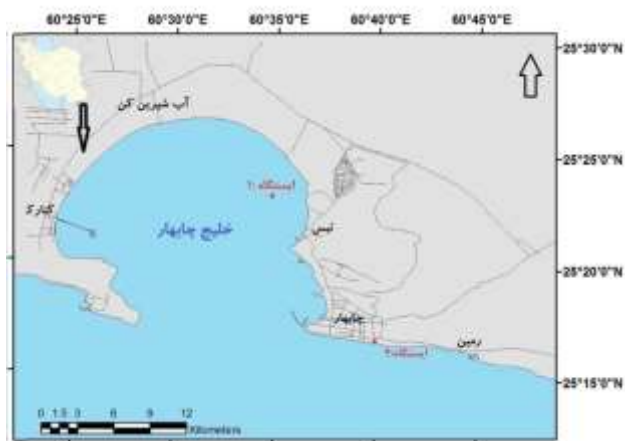
شکل ۱: نقشه موقعیت ایستگاه‌های نمونه‌برداری

نمونه‌های کاهو دریایی (تیرماه ۹۶) از ساحل صخره‌ای دریا بزرگ (دریای عمان) در هنگام جذر کامل به روش دستی جمع آوری و جهت زدودن شن، ماسه و اپی فیت‌های باقیمانده بر روی نمونه‌ها، ابتدا با آب دریا شستشو شدند. سپس نمونه‌ها در کیسه‌های پلاستیکی نگهداری و به آزمایشگاه منتقل و جهت زدودن نمک آب دریا با آب مقطر شستشو شدند و در محیط آزمایشگاه به مدت ۵ روز خشک گردیدند. نمونه‌های جلبک خشک شده ابتدا با خرد کن خانگی آسیاب شدند و سپس با دستگاه الک شیکر از الک‌های با منفذ ۵۰۰، ۲۵۰، ۱۲۵ و ۶۳ میکرون عبور داده شدند. نمونه‌های الک شده شماره‌گذاری و تا شروع کار آزمایشگاهی در کیسه‌های پلاستیکی در فریزر در دمای ۲۰- نگهداری شدند. موقعیت محل نمونه برداری‌ها نیز با دستگاه GPS ثبت شد (جدول و شکل ۱).