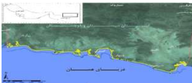
شکل ۱: محدوده پایش زیستگاه‌های تخم‌گذاری لاک‌پشت‌های دریایی

مراحل اجرایی این پروژه از تیرماه ۱۳۹۷ تا دی‌ماه ۱۳۹۷ در سواحل شمالی دریای مکران (سواحل استان سیستان و بلوچستان) صورت پذیرفت (شکل ۱). در این سواحل علاوه بر وجود بسترهای ماسه‌ای، پراکنش انواع گونه‌های مختلف جلبک‌های دریایی نیز وجود دارد که به‌عنوان منبع غذایی ارزشمند برای گونه لاک‌پشت سبز ( C. mydas ) مورد استفاده قرار می‌گیرند.