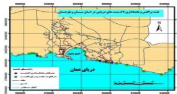
شکل ۲: نقشه پراکنش و تخم‌گذاری لاک‌پشت سبز دریایی ( C. mydas ) در سواحل استان سیستان و بلوچستان

اغلب موارد چراگاه‌ها و مکان‌های لانه‌سازی می‌بایست در نزدیکی یکدیگر واقع شده باشند (Miller et al., 2003) که این مسئله حضور لاک‌پشت‌های سبز در سواحل سیستان و بلوچستان را توجیه می‌نماید. سواحل مورد بررسی که تخم‌گذاری لاک‌پشت در آن‌ها به ثبت رسیده است با نتایج حاصل از تعیین مناطق حساس زیست‌محیطی ساحلی که توسط داور و همکاران در سال ۱۳۸۹ انجام گرفت، مطابقت دارد.