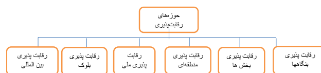
شکل ۱: سطوح گوناگون رقابت‌پذیری (Audrone & Tvaronaviciene, 2010)

مالیاتی، حمایت‌های مالی، بازنگری قوانین، حمایت‌های دولت از طرح‌های زیربنایی، و ارائه خدمات به سرمایه گذاران خارجی اشاره کرد (Sik and Seok, 2005). اولین نسل مناطق آزاد دارای رسالت تجاری بود، دومین و سومین نسل مناطق آزاد با محدودیت ایجاد صنایع و انجام خدمات شکل گرفت. مناطق پردازش صادرات ۱ حاصل تفکر این دوره طلایی است. نسل چهارم مناطق آزاد، در پی توسعه اقتصادی و انقلاب فناورانه، شکل گرفت. نسل پنجم منطقه ویژه اقتصادی جامع ۲ و ششمین نسل دارای رسالت «هم‌پیوندی منطقه‌ای در تعامل با سرزمین اصلی مبتنی بر آموزه همگرایی اقتصادی منطقه ای برای کسب درآمد ارزی و ایجاد ارزش افزوده» بودند و مناطق آزاد اقتصادی فرامرزی ۳ نامیده شده‌اند (Guangwen, 2003). زینس ۴ (2001) در رقابت پذیری ملی، بر اهمیت هم افزایی در میان بنگاه‌ها، بازارها، دولت، و فراتر از همه‌ی اینها نهادهای خوب کار کرد تأکید می‌کند (Zimnes et al., 2010). پیتلیس ۵ (2011) چهار رویکرد اصلی رقابت‌پذیری یعنی رویکرد مبتنی بر تئوری اقتصاد نئوکلاسیک، رویکرد مبتنی بر عمل (ژاپنی)، دیدگاه سیستم‌ها یا نوآوری‌ها و الماس پورتر را از هم متمایز می‌نماید (pitelis, 2011). آدورنه و همکارش ۶ (2010) بیان می‌کنند که مطالعات حاضر در باب رقابت پذیری بر مقوله‌های تحلیلی و سطوح تحلیلی زیر متمرکزند.