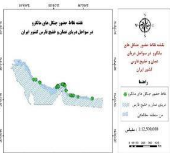
شکل ۱: موقعیت منطقه مورد مطالعه (محدوده جنگل‌های مانگرو در ایران)

نتایج حاصل از مدل‌سازی توزیع گونه‌ای حرا نشان داد متغیرهای حداقل کلروفیل، میانگین کلروفیل، مجموع حداکثر کلروفیل و pH به ترتیب بیش‌ترین تأثیر را بر پیش‌بینی حضور حرا در جنگل‌های مانگرو ایران دارند (جدول ۱، بخش ج). همچنین نتایج نشان می‌دهد در شرایط زیست‌شیمیایی حاضر بخش‌هایی از استان هرمزگان، محدوده‌ای از چابهار، شرقی‌ترین بخش استان سیستان و بلوچستان و همچنین لکه‌های زیستگاهی کوچکی در استان خوزستان بهترین مناطق برای پراکنش حرا به شمار می‌روند اما استان بوشهر به لحاظ زیست‌شیمیایی دارای حداقل پتانسیل پراکنش برای این گونه است (شکل ۳). نقشه پتانسیل توزیع گونه‌ای جنگل‌های حرا که در ۴ رده طبقه‌بندی شده نشان می‌دهد در شرایط زیست‌شیمیایی کنونی منطقه حفاظت شده حرا، منطقه حفاظت شده گابریک و جاسک، خلیج گواتر، جزیره قشم، خور آذینی، خور خلاصی، خور آبکوهی، خور احمدی، خور سمایلی و خور زنگی در مرز آبی جنوب کشور به‌طور کلی پتانسیل بیشتری برای پراکنش جنگل‌های حرا دارند (شکل ۳).