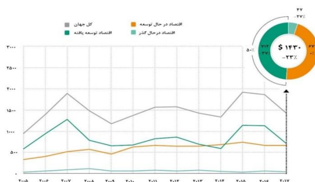
نمودار ۱: جریان سرمایه‌گذاری جهانی و سرمایه‌گذاری توسط گروهی از اقتصادها در سال‌های ۲۰۱۷-۲۰۰۵ (میلیارد دلار) (منبع: UNCTAD, 2017)

تجارت، که بهبود قابل ملاحظه‌ای در سال ۲۰۱۷ داشته است در تقابل است. بعد از رشد موقتی سرمایه‌گذاری خارجی در سال‌های ۲۰۱۰ و ۲۰۱۵، مجدداً روند نزولی این جریان‌ها که از سال ۲۰۰۸ آغاز شده بود، از سال ۲۰۱۶ ادامه داشته است. هم‌راستی تغییرات جریان سرمایه‌گذاری خارجی با روند تغییرات این جریان‌ها در اقتصادهای توسعه‌یافته حاکی از اثرگذاری بالای این اقتصادها در تغییرات جهانی سرمایه‌گذاری خارجی است. جریان‌های سرمایه‌گذاری مستقیم خارجی در اقتصادهای توسعه‌یافته و اقتصادهای در حال گذار به شدت کاهش یافته در حالی که در اقتصادهای در حال توسعه با ثبات ادامه دارد، به عنوان نتیجه، اقتصادهای در حال توسعه، سهم رو به رشد از جریان‌های سرمایه‌گذاری مستقیم خارجی در سال ۲۰۱۷ را دارا می‌باشند (UNCTAD, 2017).